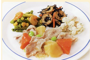
ほっとする味！定番肉じゃが 301kcal 糖質21.9g タンパク質20.4g