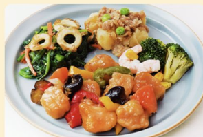
黒酢で仕上げたコクうま酢鶏 338kcal 糖質24.4g タンパク質22.4g