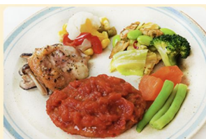
ジューシーマト煮込みハンバーグ 347kcal 糖質24.9g タンパク質21.3g