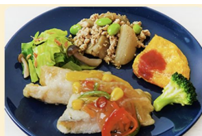
タラと彩り野菜の南蛮揚げ 336kcal 糖質23.6g タンパク質24.2g