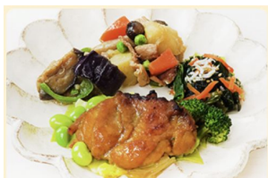
グリルチキンとうまみ肉じゃが 347kcal 糖質21.6g タンパク質20.7g