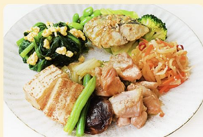
具沢山！鶏のすき焼き 347kcal 糖質22.1g タンパク質22.1g